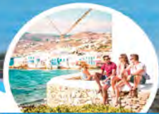
米克诺斯岛-天堂海滩

天堂海滩是米克诺斯岛代表性的海滩。常用“4S”来形容这里：Sun-阳光、Sea-海洋、Sand-沙滩和Sex-性感。 * 需要客人自行乘坐 Shuttle 巴士到天堂海滩